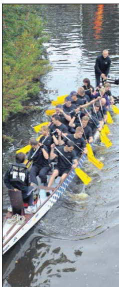
Das Ufer so nah: Manchmal hieß es volle Kraft zurück.