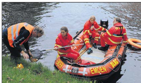
Die DLRG-Helfer im Einsatz: Diesmal mussten sie Plastikentfernschiffen, nachdem ein Drachenboot ziemlich Wellen schlug.