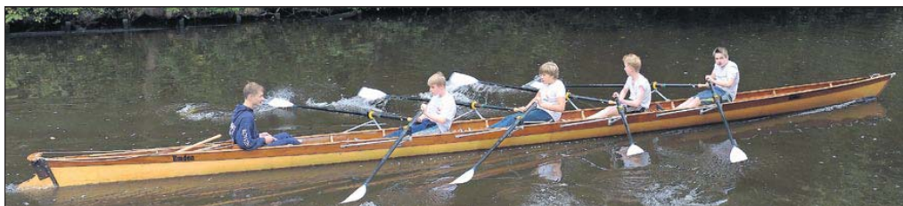
Auch die Ruderer wollten es auf dem Rundkurs wissen: 15 Meldungen gab es bei den Doppelvierern.

gehörsen Frauen und Polizisten zusammen“, sagte Plewka. Dragonpatrol hatten extra morgens eine Einführungsrunde gedreht, damit sich alle mit der Strecke vertraut machen konnten. „Im Rennen war dann aber die linke Seite etwas übermotiviert und wir sind auf eine Wand zugefahren.“ Und dann lag er auch schon im Wasser. „Unser Team ist aber super eingestellt und hat das gut weggesteckt.“