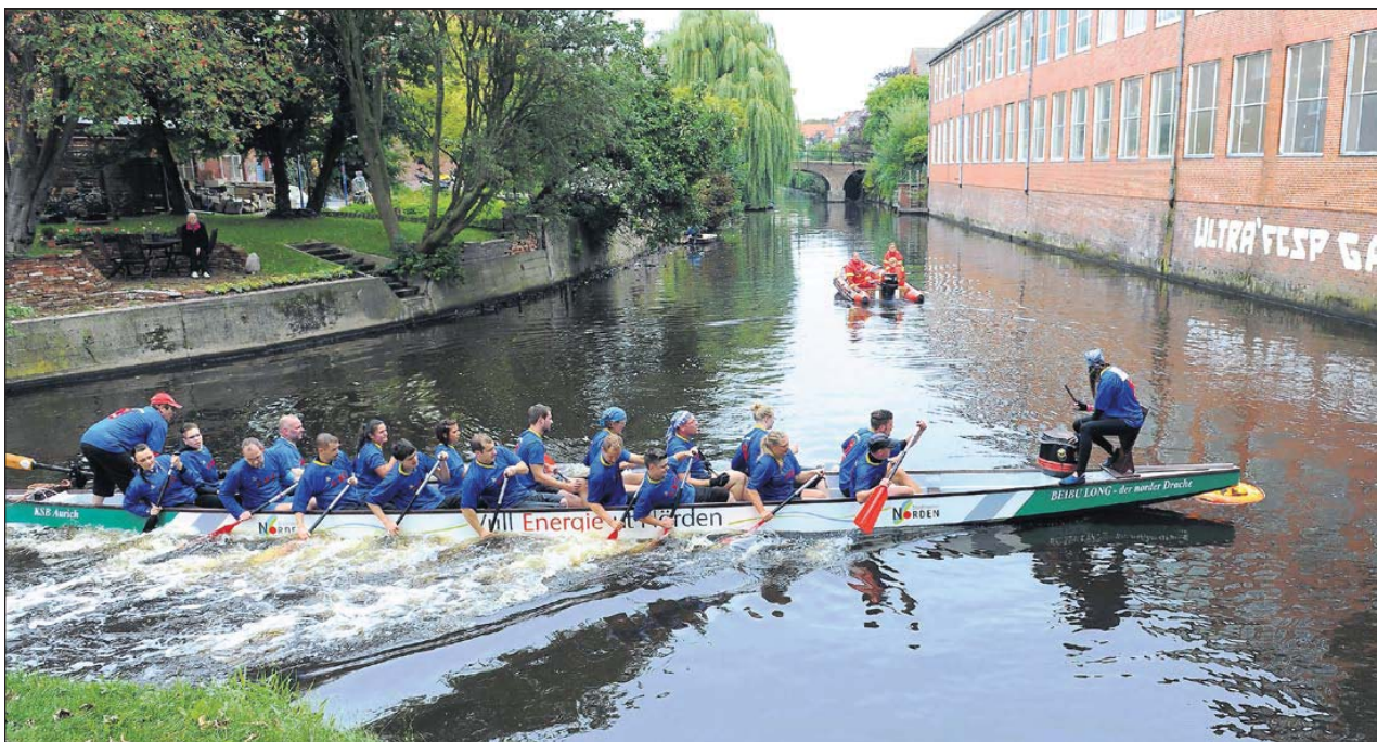
Eine der Stellen mit einer ganz engen Kurve: Hier galt für die Boote ein Stopp.

Keinen ungewöhnlichen Namen, dafür aber die weiteste Anreise: Aus Bochum kommt das Team Dragonpatrol, und das hat außergewöhnliche Paddler an Bord. „Wir setzen uns aus Brustkrebsüberlebende,